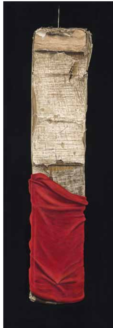
IV Dombibliothek, Hildesheim