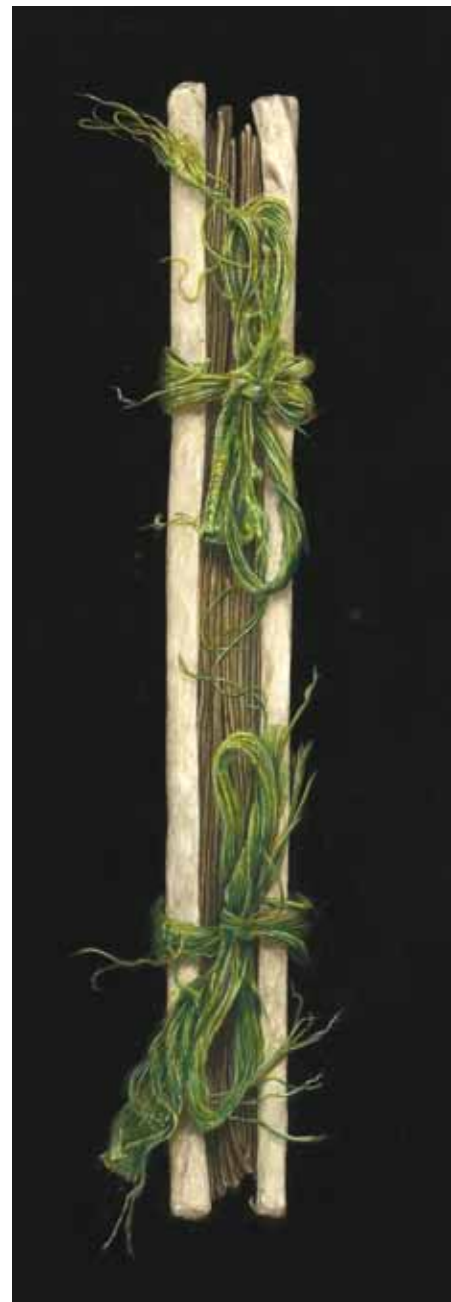
V Stiftsbibliothek, St. Gallen