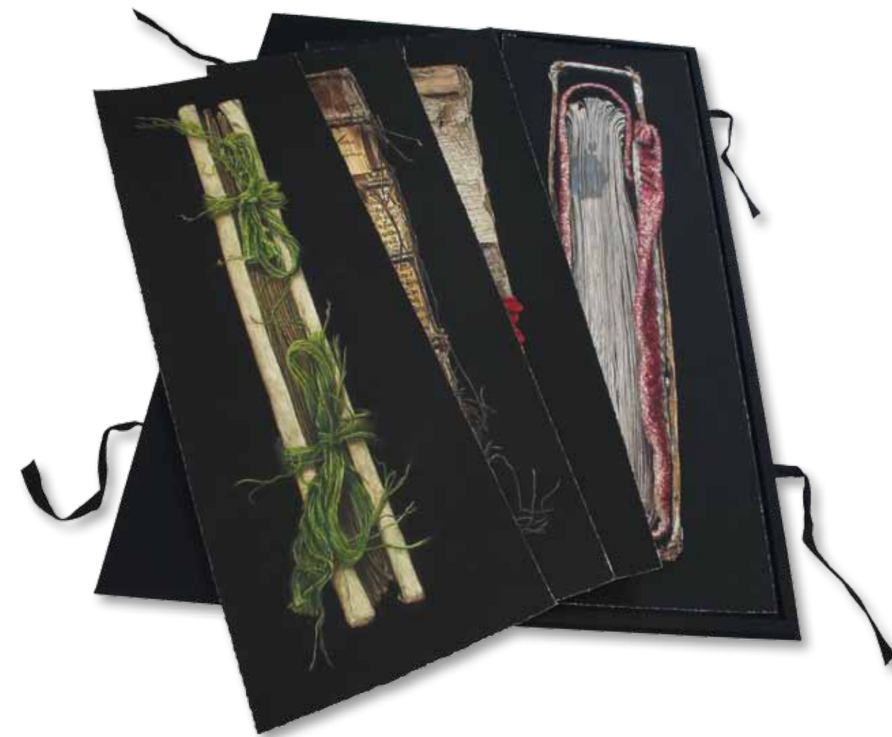
Sieben grafische Blätter in handgefertigter Mappe