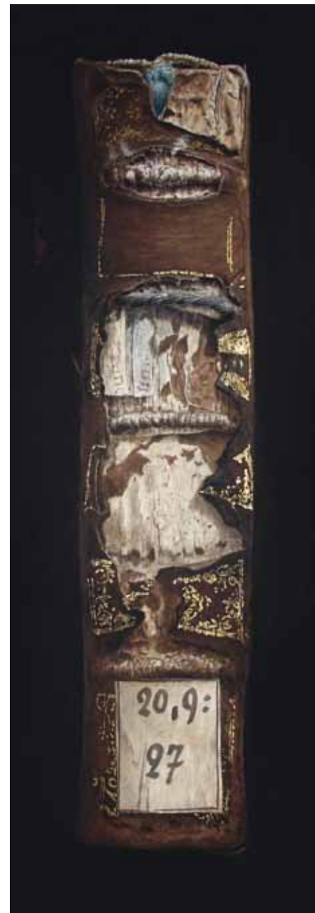
VII Herzogin Anna Amalia Bibliothek, Weimar