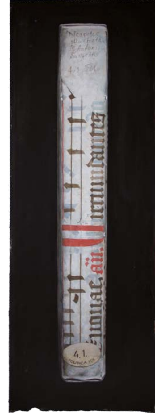
Solitaire V Herzog August Bibliothek, Wolfenbüttel