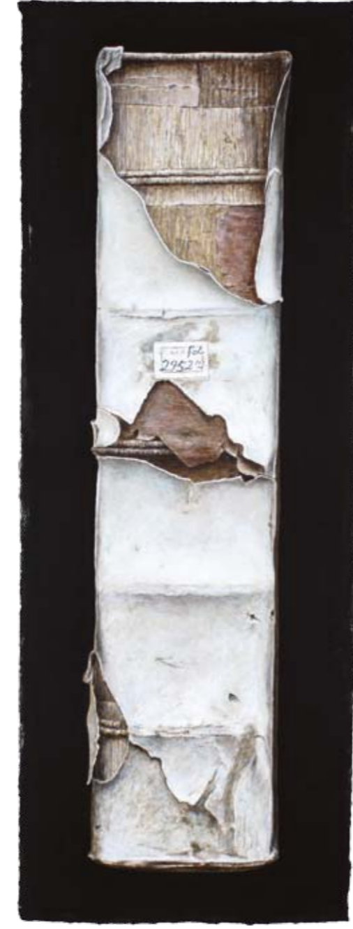
Solitaire IV Scharbausaal, Lübeck