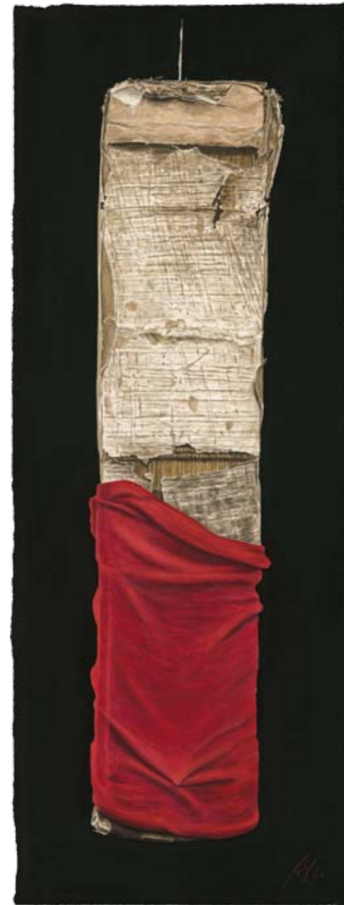
Solitaire XII Dombibliothek, Hildesheim