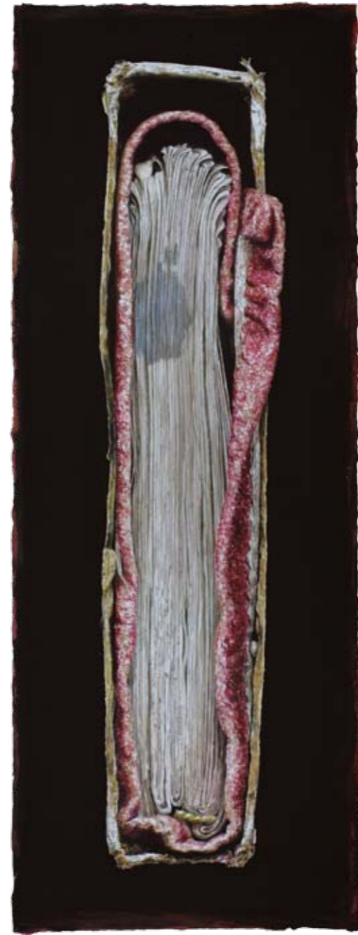
Solitaire II Universitäts- und Landesbibliothek, Darmstadt