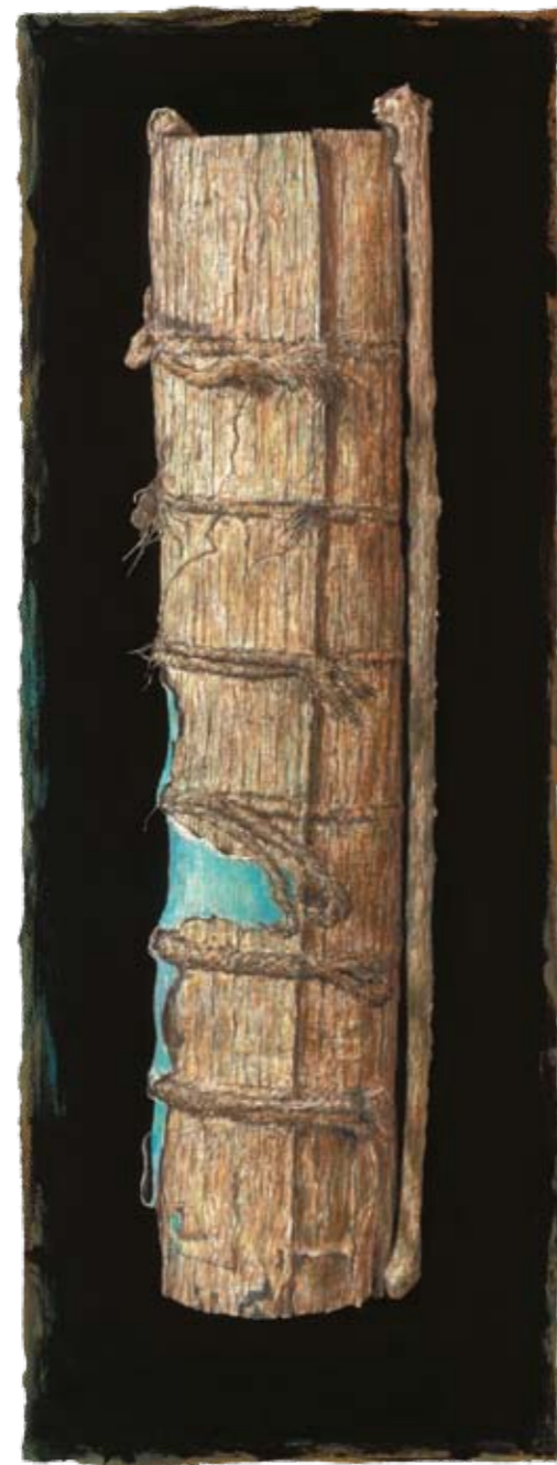
Solitaire I Bibliothèque Humaniste, Sélestat

www.bibliotheken-projekt.de info@bibliotheken-projekt.de