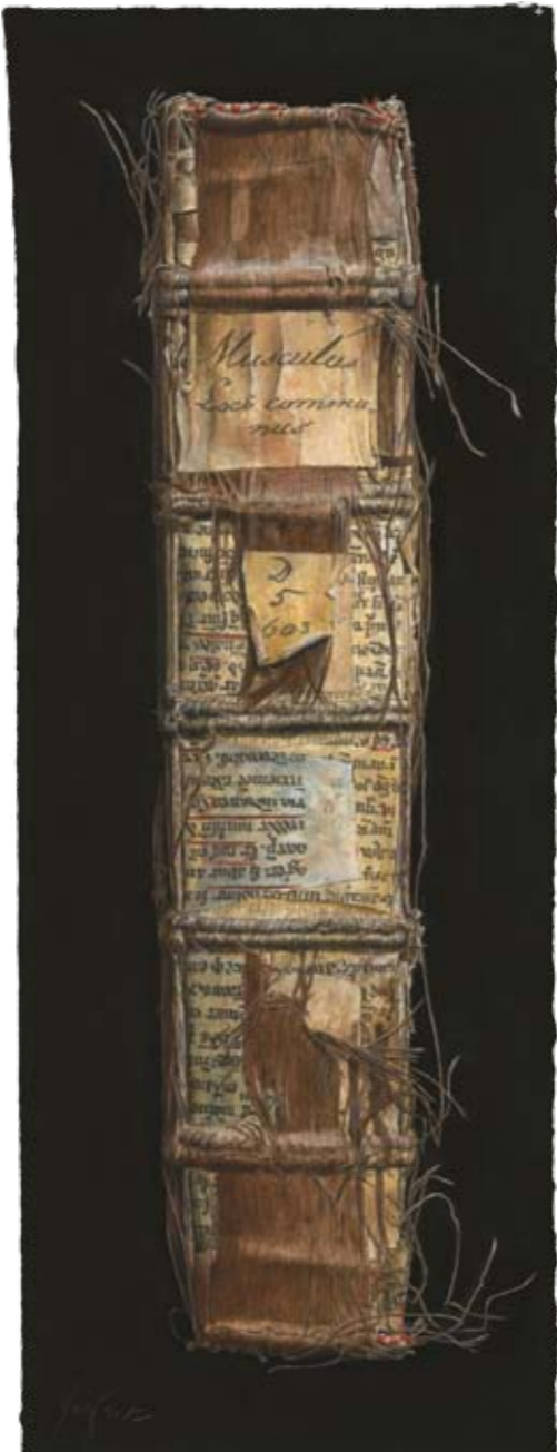
Solitaire IX Nicolaus-Matz-Bibliothek, Michelstadt