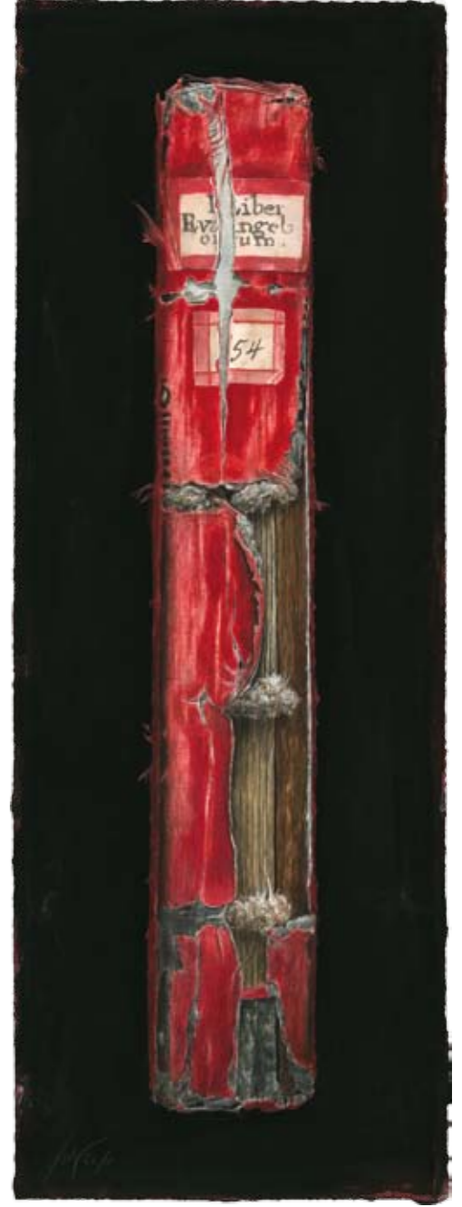
Solitaire VI Stiftsbibliothek, St. Gallen