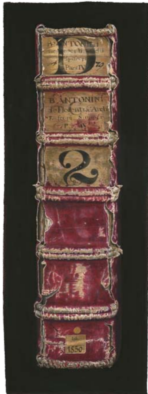
Solitaire X Gutenberg-Museum, Mainz