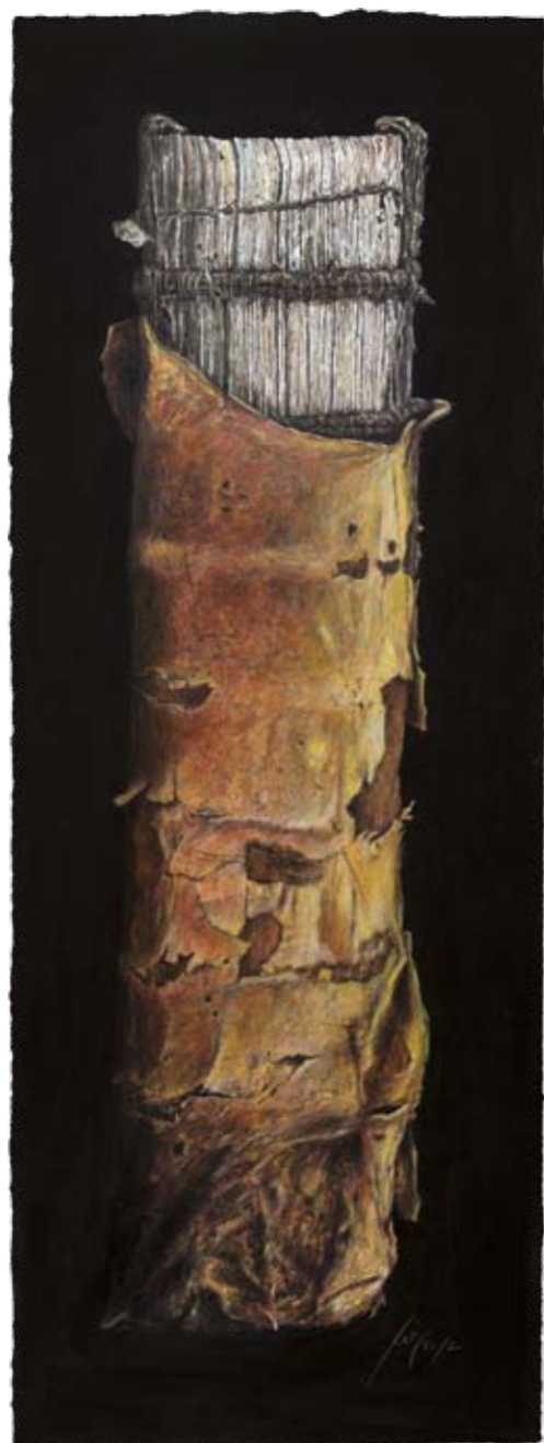
Solitaire VIII Abteibibliothek, Marienstatt