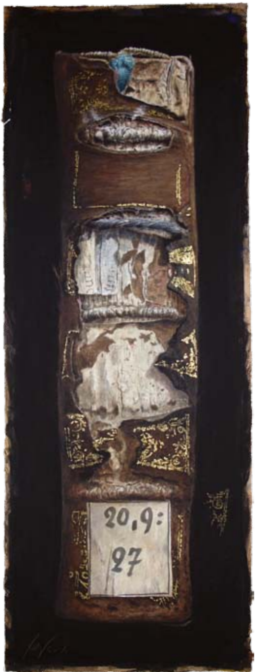
Solitaire VII Herzogin Anna Amalia Bibliothek, Weimar